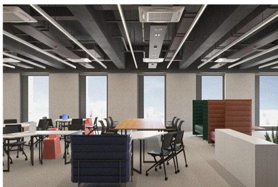
■執務室内のイメージ